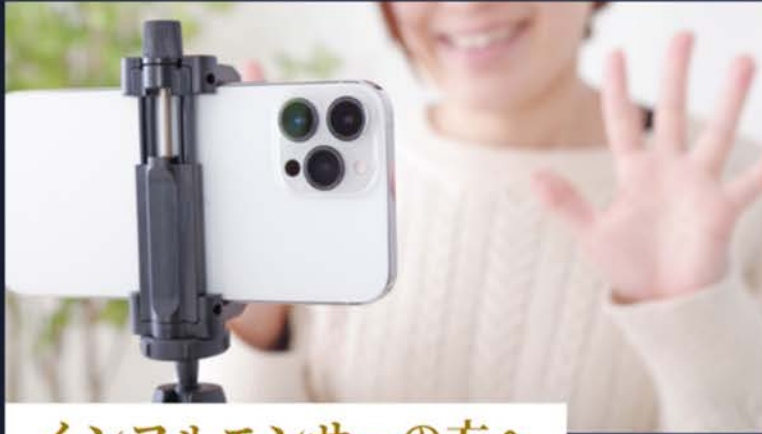
インフルエンサーの方へ